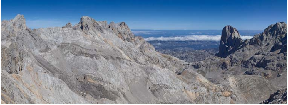
Links Torre de Ceredo, rechts Naranjo de Bulnes