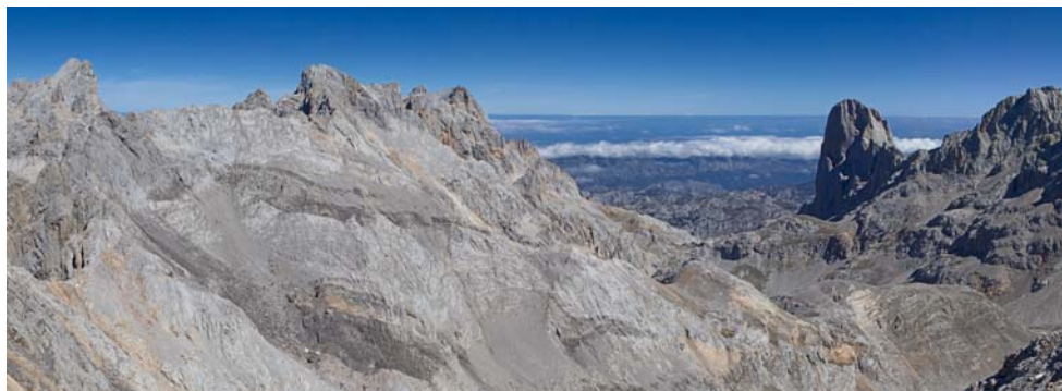
Links Torre de Ceredo, rechts Naranjo de Bulnes